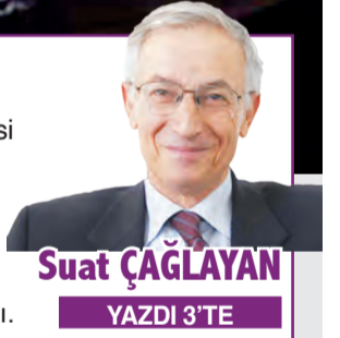
Suat ÇAĞLAYAN YAZDI 3'TE

■ BEN Urla, Çeşmealtı'nda oturuyorum. Evimin bahçesi iyi korunmadığı için domuzlar girer. Geçen akşam bahçeye girip pencereye yaklaştı. Erkek domuzlar yaşlanınca aileden dışlanır, tek başına kalırlar. Bu da onlardan biri olsa gerek. TV'de Kılıçdaroğlu ile yapılan röportajı izliyorduk. Erkek domuz, pencerenin dışına gelerek Kılıçdaroğlu'nu izlemeye başladı.