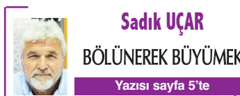
Sadık UÇAR BÖLÜNEREK BÜYÜMEK Yazısı sayfa 5'te