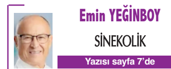
Emin YEĞİNOY SİNEKOLIK Yazısı sayfa 7'de