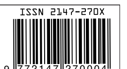
ISSN 2147-270X 9 772147 270004

■ TÜRKİYE İstatistik Kurumu (TÜİK) verilerine göre yılın ilk üç ayında yoğurt, ayran ve kefir üretimindeki artış dikkatleri çekti. ■ 4'TE