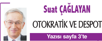
Suat ÇAĞLAYAN OTOKRATİK VE DESPOT Yazısı sayfa 3'te

Körfezde balık ölümleri ve kokuya neden olan deniz marullarına yönelik İZDENİZ yoğun çalışma başlattı. Uzmanlar, Gediz'deki kirliliğe müdahale edilmesi çağrısı yaptı.