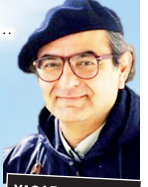
YAŞAR AKSOY'UN HAZIRLADIĞI YAZI DİZİSİ SAYFA 6'DA