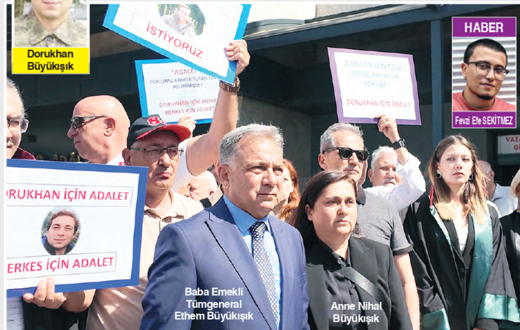
Baba Emekli Tümgeneral Ethem Büyükişik

Emekli Tümgeneral Ethem Büyükişik'in oğlu Dorukhan'ın 2018 yılında İzmir'de bir inşaat şantiyesinde şüpheli şekilde ölü bulunmasıyla ilgili "görevi ihmal" suçlamasıyla polis memurlarının yargılanmasına başlandı