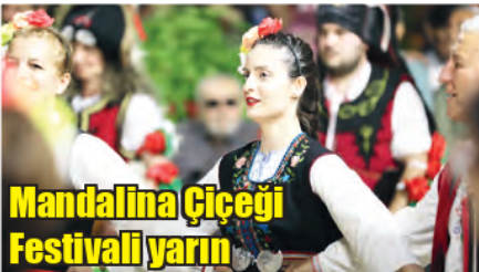
Mandalina Çiçeği Festivali yarıyor

■ MENDERES Belediyesi tarafından Mandalina Çiçeği Festivali 21-23 Mayıs tarihlerinde düzenlenecek. Festivalde 5 ülkeden onlarca kişi sahne alacak. ■ 3'TE