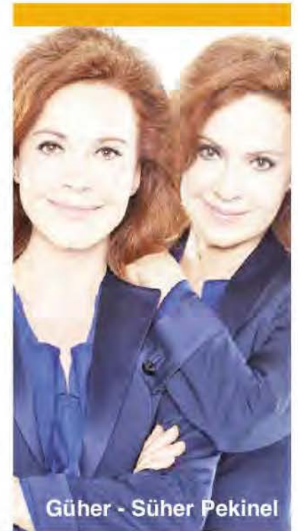
Güher - Süher Pekinel

Kendilerini Avrupa'nın sıcak ve samimi zengin oda müziği geleneğine ve ona yenilikçi yaklaşımlar eklemeye adanmış Ensemble Raro, 19 Haziran